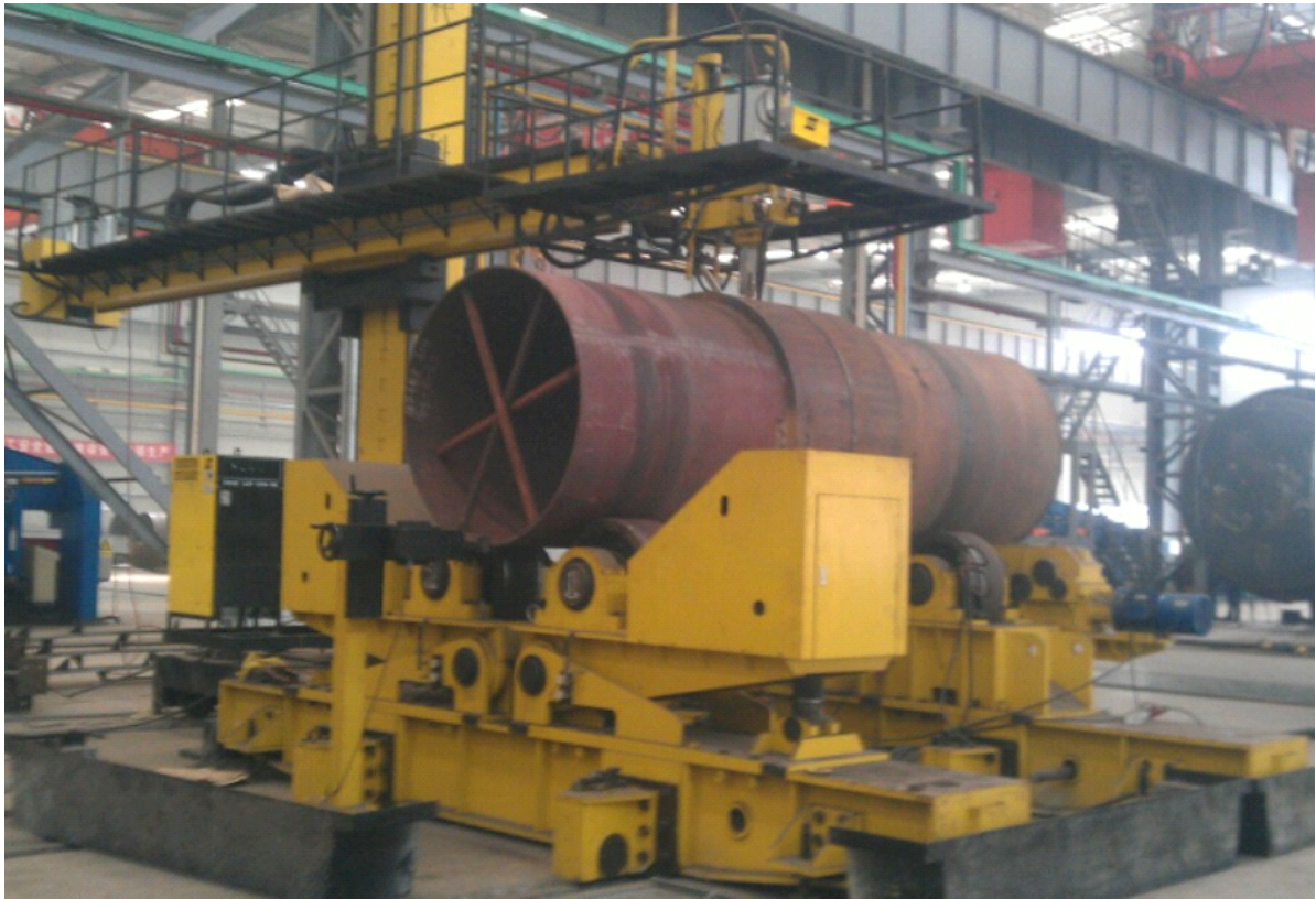
用户使用现场(时代重型操作机+时代单丝窄间隙机头+伊萨埋弧焊电源+300吨自动防窜滚轮架)

服务电话: 400-660-9391 网址: www.timewelder.com